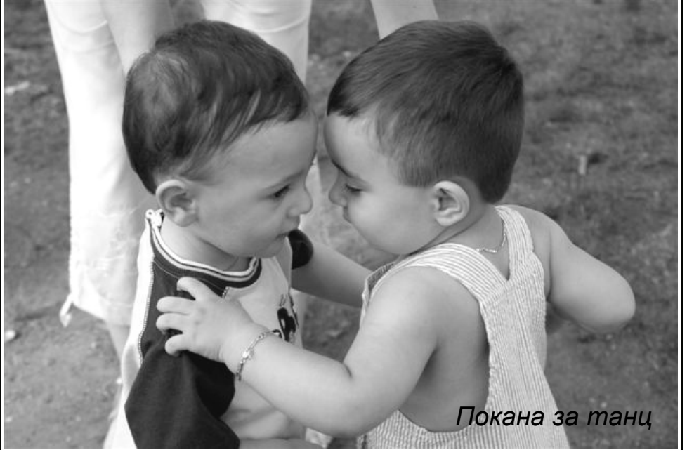
Покана за танц

Вашето дете! Очакваме снимките Ви на editor@balkanecho.com